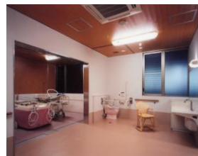
寝たきりの方用特殊浴槽