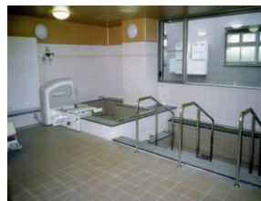
大浴槽・リフト浴槽

トゴール鉱石による準天然温泉で 風呂の種類を 細かく分け その方にあった浴槽でご入浴いただきます