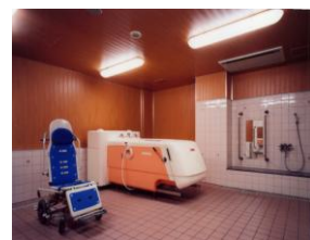
車椅子用機械浴槽