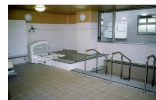
大浴槽・リフト浴槽