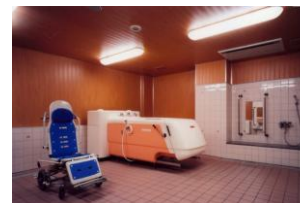
車椅子用機械浴槽