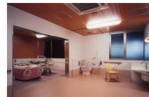
寝たきりの方用特殊浴

トゴール鉱石による準天然温泉で風呂の種類を 細かく分けその方にあった浴槽でご入浴いただきます