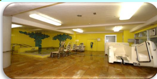
大浴槽と機械浴槽