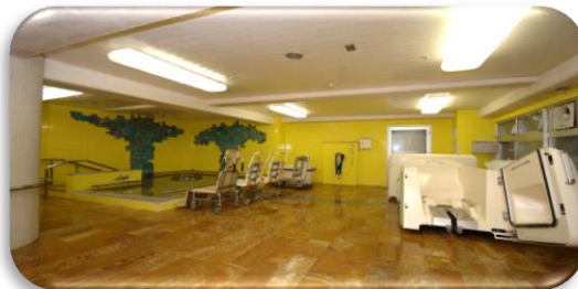
大浴槽と機械浴槽